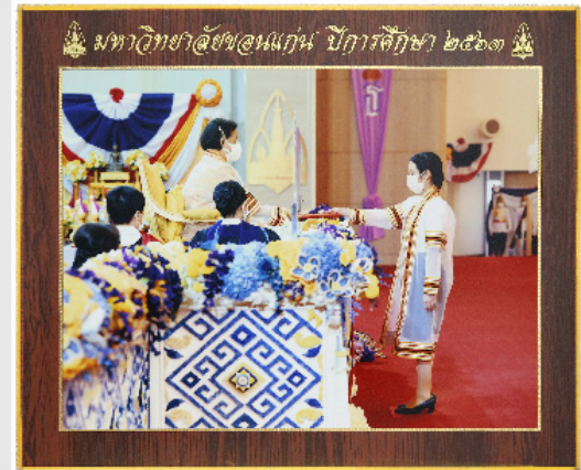
กรอบหลุยส์ (B) 11"x14"