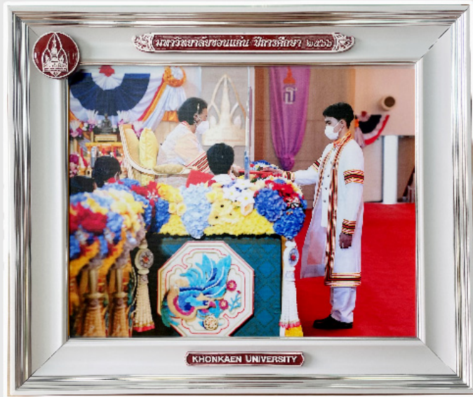
กรอบวิทย์ขอบทอง 10"x12"