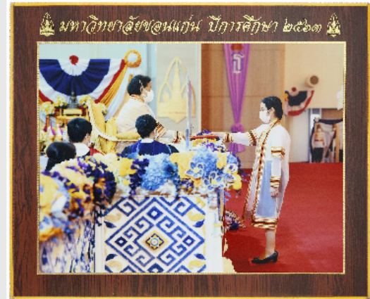
กรอบวิทย์ขอบทอง 10"x12"