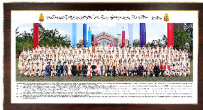
ภาพหมู่กรอบวิทย์ขอบทอง