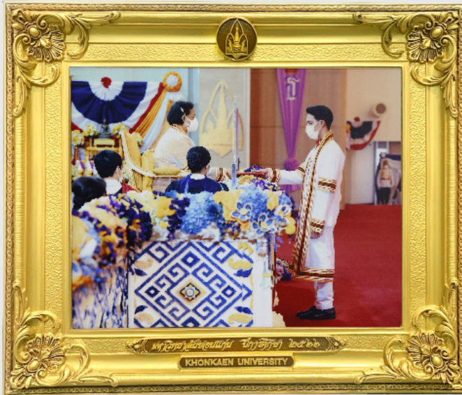
กรอบวิทย์ขอบทอง 10"x12"