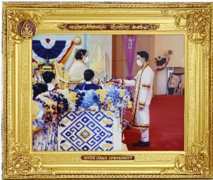
กรอบวิทย์ขอบทอง 10"x12"