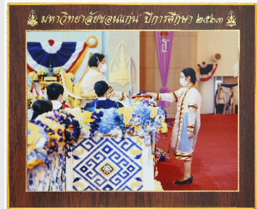
กรอบหลุยส์ (A) 11"x14"