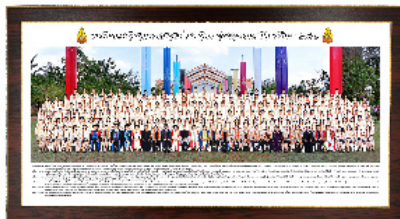
ภาพหมู่กรอบวิทย์ขอบทอง