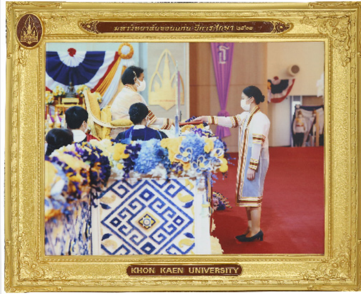
กรอบศิลป์ 11"x14"