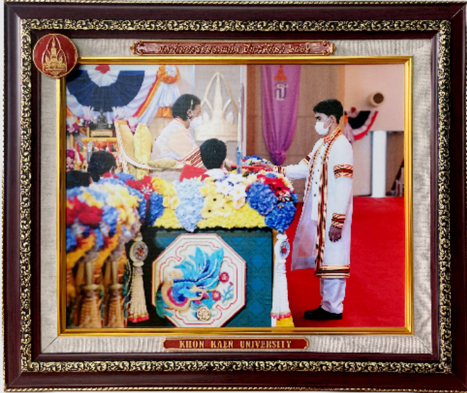
กรอบวิทย์ขอบทอง 10"x12"