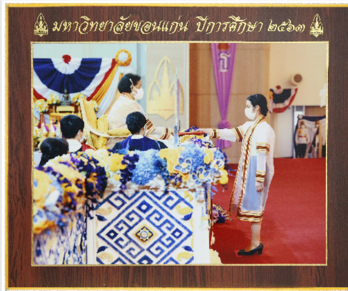
กรอบวิทย์ขอบทอง 10"x12"