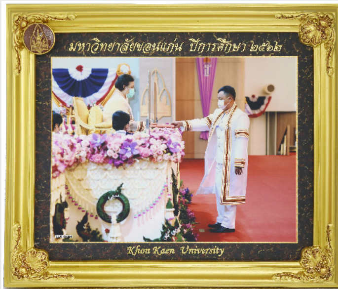
กรอบวิทย์ขอบทอง 10"x12"