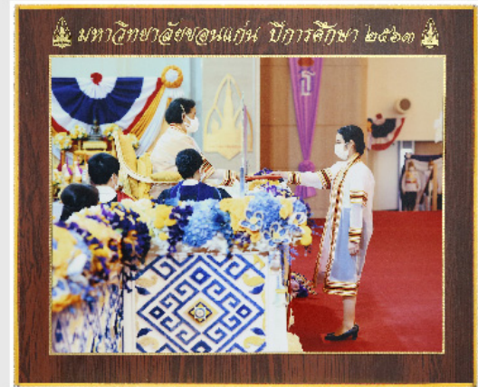
กรอบวิทย์ขอบทอง 11"x14"